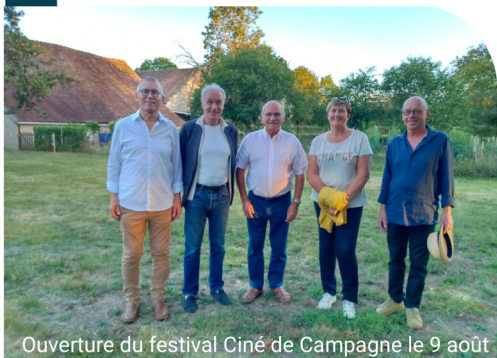
Ouverture du festival Ciné de Campagne le 9 août

Sans trop en dire, ce que l'on peut dès à présent annoncer, ce sont les dates (7, 8, 9, 14, 15 et 16 août) et 5 lieux de projection sur 6, à savoir les communes n'ayant pas encore accueilli le festival (Dunet, La Châtre-l'Anglin, Parnac, Saint-Benoît-du-Sault, Saint-Gilles).