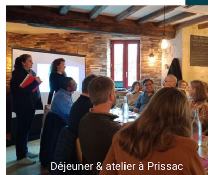
Déjeuner & atelier à Prissac

Envie de vous informer, de réseauter, de promouvoir votre activité ? De nouveaux rendez-vous auront lieu en 2024 !